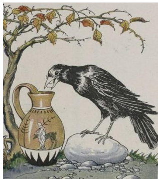
นิทานอีสปเรื่อง กากับเหยือกน้ำ เตือนให้เราเห็นคุณค่าของความคิดสร้างสรรค์