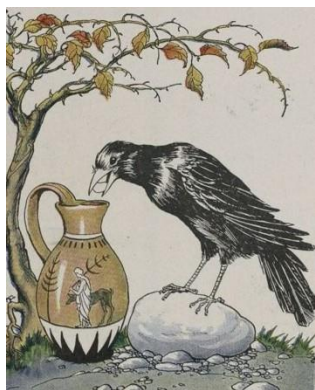
Басня Эзопа о Вороне и Кувшине напоминает нам о ценности творчества.

может случиться, когда процесс должным образом не контролируется. Не имея такого опыта мы рассчитываем на то, что обучение, тренировки и инструкции помогут нам безопасно выполнять повседневную работу. Но когда нет убедительной связи между тем, «что делать» и «почему мы делаем это именно таким образом», можно прийти к самоуспокоенности. Почему нужно следовать всем этим процедурам управления безопасностью процессов, если трагические происшествия никогда не происходят? Мы склонны забывать, что аварии не случаются так часто именно потому, что мы следуем требуемым процедурам. Самоуспокоенность и несоблюдение инструкций являются одними из первых шагов к трагедии.