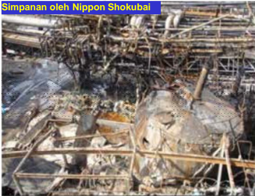
Gambar 1: Tank AA yang telah musnah