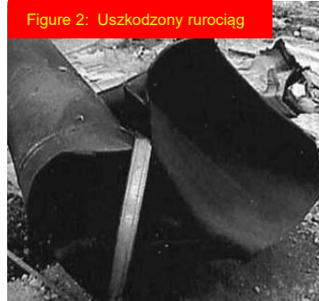
Figure 2: Uszkodzony rurociąg