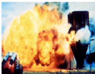
Figura 2: La pols ventejada continua cremant fora del recipient.

El gràfic mostra que es produeixen explosions de pols en moltes indústries i operacions. Tot i que una petita part de les explosions estudiades són a la indústria química, es manipulen sòlids en tot el flux de producció, des de la recepció de la matèria primera fins al producte final.