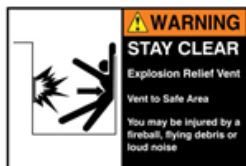
Figura 3: Senyal d'avís de venteig d'explosió.