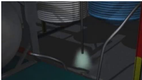
Figure 2. Rejet de vapeur en point bas au niveau de la zone de traitement

Le 12 avril 2004, un chimiste à façon basé à Dalton (Géorgie, États-Unis) fabrique du cyanurate de triallyle. Un emballage thermique a eu lieu, et des vapeurs inflammables et toxiques d'alcool allylique et de chlorure d'allyle ont été émises dans l'atmosphère. Les vapeurs ont été libérées par le trou d'homme mal scellé (Figure 1) et de façon plus importante par l'événement du disque de rupture qui déchargeait près de la base du réacteur (Figure 2). Les rejets de vapeurs ont conduit à l'évacuation de plus de 200 familles vivant dans les environs.