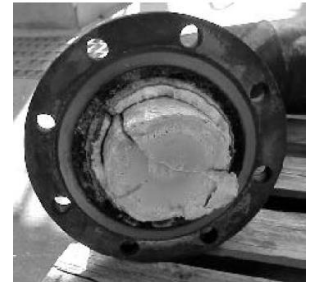
Obr. 1: Ucpané ventilační potrubí

Proč údržbáři otevřeli tuto nádrž, i když byla pod tlakem? Během najíždění výroby byl do této nádrže přeměrován produkt mimo specifikaci, ze kterého se uvolňoval plyn a kvůli ucpání odvětrávání / odtlakování došlo k nárůstu tlaku. Tlakoměr (místní manometr) byl také zanešený a neukazoval žádný tlak.