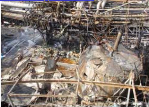
Figura 1: Tanque de AA destruído