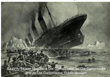
By Willy Stöwer, Magazine Die Gartenlaube, en:Die Gartenlaube and de:Die Gartenlaube, Public domain.