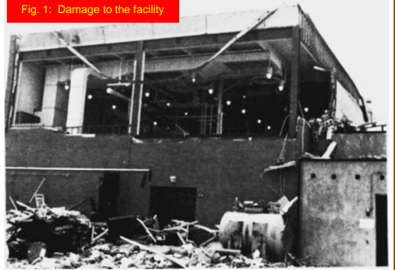
Fig. 1: Damage to the facility

1986లో ఒక ఫైల్డ్ ఫ్లాంటు నందు గల 10 గ్యాల్లన్లు (~38 l) కొద్దిగా కలుపుతున్న వెనెల్ నందు ప్రేలుడు సంభవించింది. ఒక ఆక్సిడేషన్ రసాయనిక చర్య శుద్ధ ఆక్సిజన్ వాతావరణంలో అనగా 250 psig (1825 KPa). వద్ద జరిగినది. అది భద్రతాపరమైన చర్యగా భావించారు. ఎందుకంటే అప్పుడు వెనెల్లో గల ఉష్ణోగ్రత దాని ఫ్లాష్ పాయింట్ కన్నా 50°C తక్కువగా ఉన్నది, వాతావరణంలో, ద్రావణాల నుంచి వెలువడే భాషువాయువులు కూడా ప్రేలుడు సంభవించజేసే పాయింట్ కన్నా తక్కువ వద్ద ఉన్నాయి. అన్ని ప్రాసెసింగ్ పరిస్థితులు సక్రమంగానే ఉన్నాయి. అయితే 41 నిమిషాల తర్వాత ప్రేలుడు హఠాత్తుగా సంభవించింది. దాని ప్రభావంతో రియాక్టర్ 750 psig (~5200 KPa) వద్ద బ్రద్దలైనది (చిత్రం.1) తద్వారా ఫ్లాంటుకు భారీ నష్టాన్ని కలిగించి, అనేక చిన్న చిన్న మంటలను వ్యాప్తి చేసింది, అదృష్టవశాత్తు ఎవ్వరికీ గాయాలు కాలేదు.