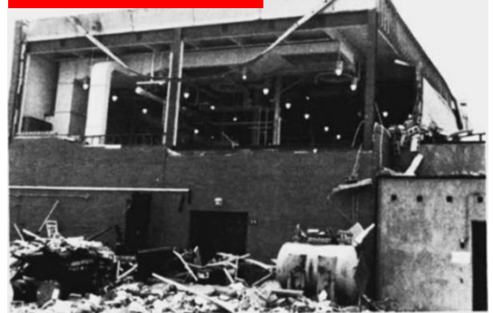
1. ábra: A káresemény helyszíne

[Hivatkozás: Kohlbrand, H. T., Plant/Operations Progress 10 (1), pp. 52-54 (1991).]