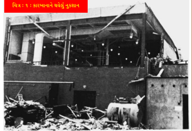
ચિત્ર : ૧ : કારખાનાને થયેલું નુકશાન

વેસલ દ્રાવણના ફ્લેશ પોઇન્ટ કરતાં નીચાં તાપમાને કામ કરતું હોવાથી અને વેસલની અંદરના વાતાવરણમાં ફ્યુલ વેપરની માત્રા આગ ચાલુ કરવા માટે ઘણી ઓછી હતી. આ કારણે ઘડાકા માટેનું કોઈ જોખમ ન હતું, પરંતુ ફ્યુલ ફક્ત વેપર તરીકે હોય તેમ નથી (યાદ કરો ડસ્ટ નો ઘડાકો). તપાસને અંતે એવું બહાર આવ્યું કે વેસલના એજીટેશનને કારણે સુક્ષ્મ ઝાકળરૂપે પ્રવાહીના નાનાં બિંદુઓ બન્યા (જુઓ ચિત્ર ૨). આ નાનકડાં બિંદુઓનું સરેરાશ માપ લગભગ ૧ માઈક્રોન હતું. આ ઝાકળનાં નાનકડાં બિંદુઓની સરખાણી એ માણસોના વાળનો વ્યાસ ૪૦-૫૦ ગણો મોટો છે. ફ્લેમેબીલીટી કસોટીમાં એવું સાબિત થયું કે ૩મ તાપમાને હવામાં ઝાકળના નાનકડાં બિંદુઓ સળગી શકે છે અને ઝાકળના નાનકડાં બિંદુઓ શુદ્ધ ઓક્સીજન વાળા વાતાવરણમાં વધુ સહેલાઈથી સળગી શકે છે. વેસલમાં ફ્યુલ અને ઓક્સિજન બંને હતાં – પરંતુ અગ્નિસ્ત્રોત ક્યાં હતો ? બરેબર તો આ ઘડાકામાટે કારણભુત અગ્નિસ્ત્રોત ને શોધવો ઘણું મુશ્કેલ છે , પરંતુ તપાસમાં એવું નક્કી થયું કે અગ્નિસ્ત્રોત નુ કારણ અશુદ્ધિઓ હતી, જે અગાઉના પ્રયોગોમાં રહી ગઈ હશે. જેનું ડીકંપોઝીશન થયું અને એટલી ગરમી ઉત્પન્ન થઈ જે ઝાકળનાં નાનકડાં બિંદુઓમાં આગ શરૂ કરવા પુરતું હતું.