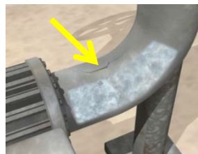
Adakah paip ini retak?