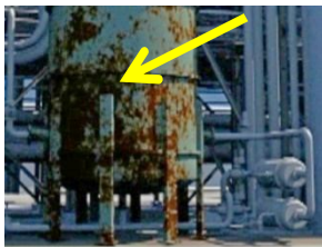
Tangki yang kelihatan berkarat!