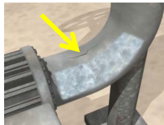
이 배관에 있는 것이 균열인지?