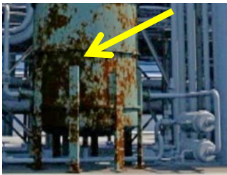
녹슬고 부식된 것으로 보이는 탱크