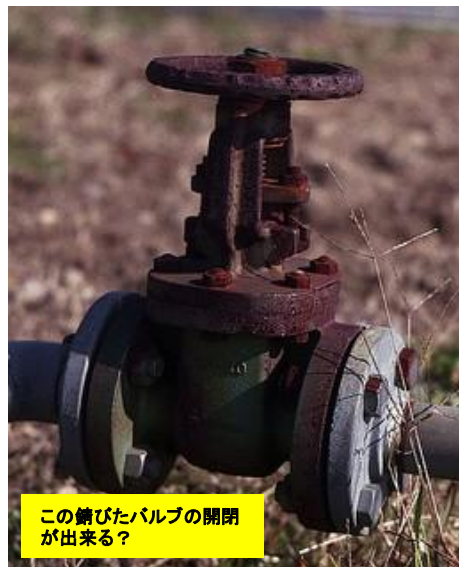
この錆びたバルブの開閉が出来る？