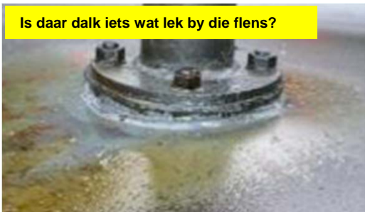
Is daar dalk iets wat lek by die flens?