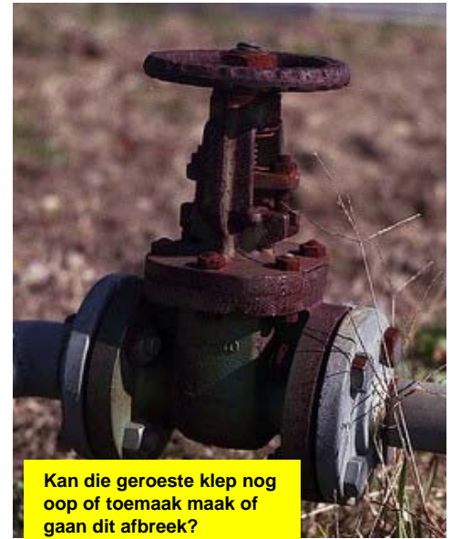
Kan die geroeste klep nog oop of toemaak maak of gaan dit afbreek?

Die foto's wys voorbeelde van probleme wat jy dalk op jou aanleg kan kry.