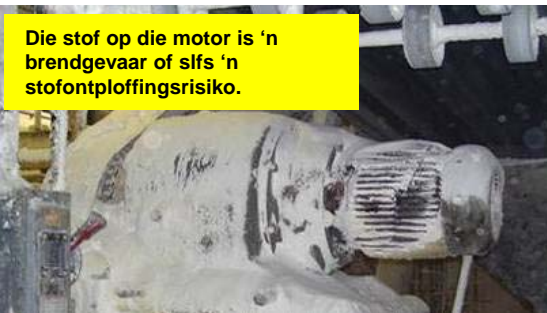
Die stof op die motor is 'n brandgevaar of slfs 'n stofontploffingsrisiko.