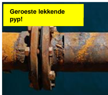
Geroeste lekkende pyp!