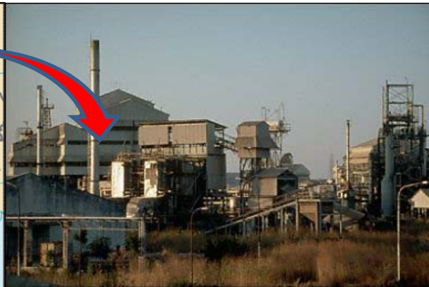
Planta de Union Carbide Bhopal